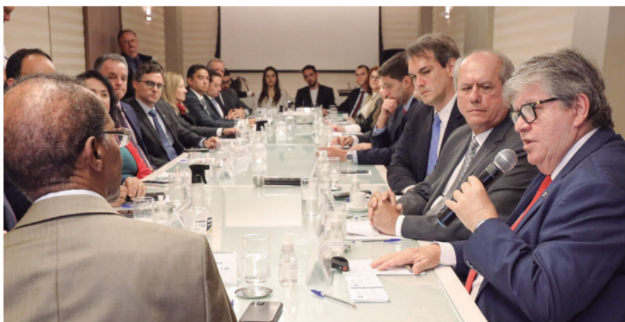
O governador ressaltou a importância do esforço entre os Poderes para garantir uma solução ágil para as demandas

Na ocasião, o chefe do Executivo estadual ressaltou a importância do esforço conjunto entre os Poderes para garantir uma solução ágil para as demandas dos cidadãos. “Esse momento é de uma grande relevância porque estamos agindo de forma coletiva para darmos um resultado que chegue mais próximo do cidadão. Essa é uma ação que dará uma resposta mais rápida à sociedade e segurança aos magistrados na tomada de decisão e estamos